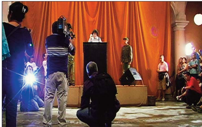
TANIA BRUGUERA (Cuba, 1968) Tatlin's Whisper # 6 (Havana Version) / El Suspiro de Tatlin # 6 (versión de la Habana) , 2009, Video, 40:30 min

Páginas web de redes sociales como Facebook y Twitter han cambiado la forma en la que las ideas políticas son transmitidas. Ahora somos capaces de llegar a un mayor número de gente al subir un video a YouTube que al pasar folletos en la calle o llamar por teléfono. El video también está conectado a nuestras vidas diarias más que otras formas de arte como la pintura y la instalación. Tal vez esta es la razón por la que las artistas de esta sección han decidido usar esta forma de arte para transmitir sus mensajes políticos .