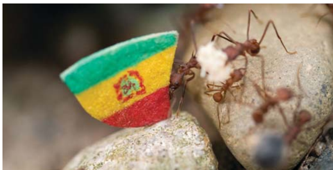
DONNA CONLON (USA/Panamá, 1966) Coexistence / Coexistencia , 2003 Video, 5:26 min, Cortesía de la artista

Colonialismo: El control de un lugar por personas provenientes de otro país—usualmente de un país lejano. Las colonias son creadas comúnmente en áreas en vías de desarrollo donde un grupo con mayor poder toma control de la tierra y los recursos. Todos los países de Latinoamérica fueron colonias alguna vez.