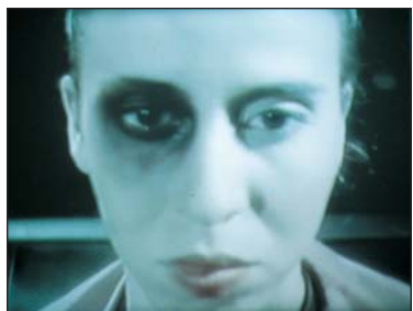
PRISCILLA MONGE (Costa Rica, 1968) La lección de maquillaje. Lección # 1 / Make up Lesson. Lesson # 1 , 1998 Video, 3 min, Cortesía de la artista

ANALIZA: ¿Cuál es la diferencia entre un video de arte político y los videos creados por la gente en YouTube con mensajes políticos ?